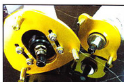
New Damper Series