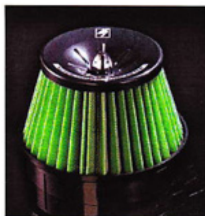
New Air Cleaner Series