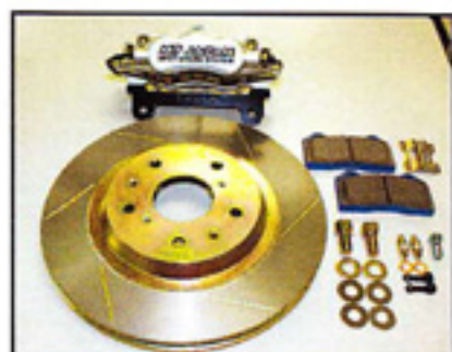
New Brake System Series