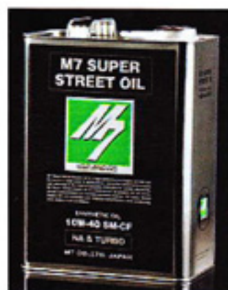
New Oil Series