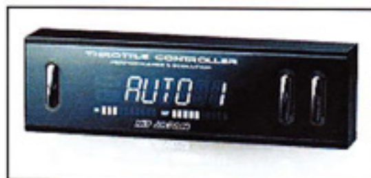
New Electronics Series