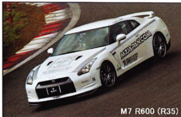
M7 R600 (R35)