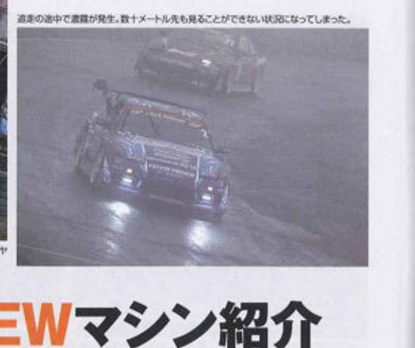
道中の途中で濃霧が発生。数十メートル先も見ることができない状況になってしまった。