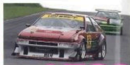
超進化系 AE86 ALL HOKKAIDO 86 DAY with DTCC

CR-Z&CR-X/180SX/BNR32/MR2/RX-7/CIVIC 他多数