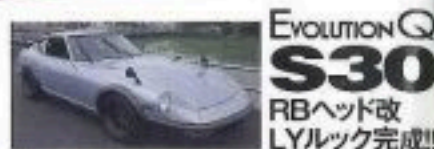
EVOLUTION Q S30 RBヘッド改 LYルック完成!!