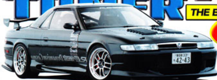
Eunos Cosmo: Wankel-Coupé mit 550 PS!