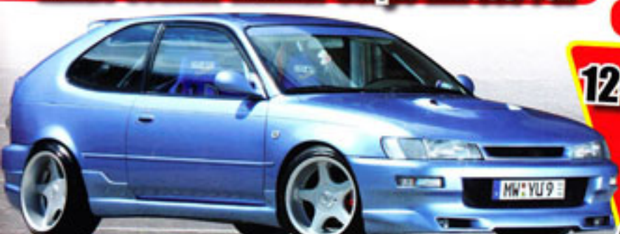
Oldschool-Beauty: Toyota Corolla E10

12-Seiten-Special zum Herausnehmen Tokyo Auto Salon