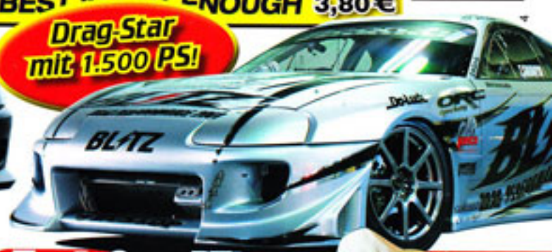
Toyota Supra Blitz