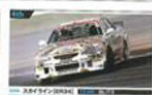
15 矢野 (19歳) トヨタ自動車 2010年全日本ラリー選手権 総合優勝 トヨタ自動車 2010年全日本ラリー選手権 総合優勝 トヨタ自動車 2010年全日本ラリー選手権 総合優勝