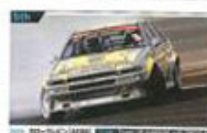
14 加藤 (19歳) トヨタ自動車 2010年全日本ラリー選手権 総合優勝 トヨタ自動車 2010年全日本ラリー選手権 総合優勝 トヨタ自動車 2010年全日本ラリー選手権 総合優勝