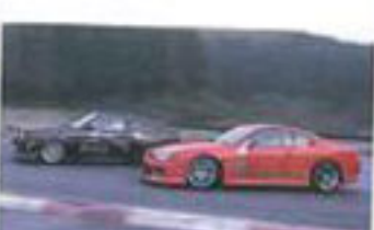
D1GP発足当時のドライバーたち