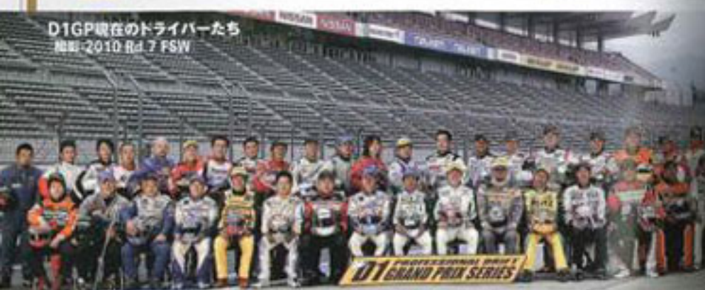
D1GP現在のドライバーたち 撮影: 2010 Rd.7 FSW