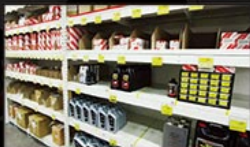
SPARE PARTS / ACCESSORIES