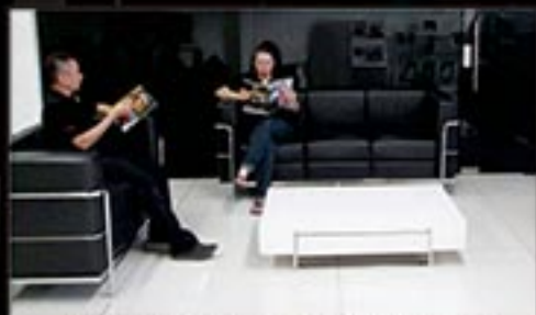
CUSTOMER LOUNGE / WIFI