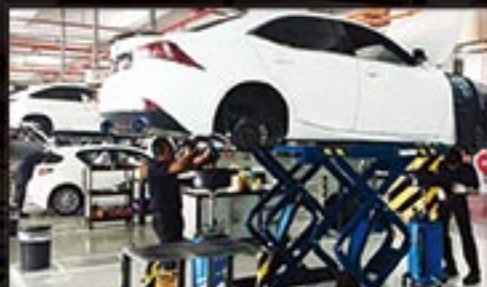
ONE STOP SERVICE CENTER

GENERAL SERVICE TYRE SERVICE BODY WASH & GROOMING SPARE PARTS