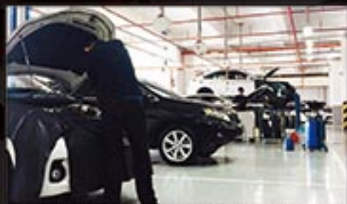
ONE STOP SERVICE CENTER