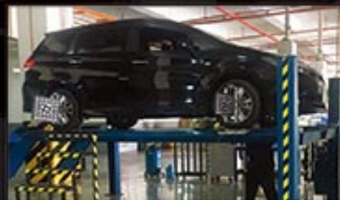
WHEEL ALIGNMENT / BALANCING