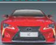
LEXUS LC 500 LAUNCHED IN MALAYSIA