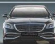
MERCEDES-BENZ S-CLASS MAYBACH ULTIMATE IN EXCLUSIVITY