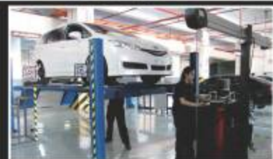
WHEEL ALIGNMENT / BALANCING