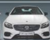
MERCEDES-BENZ E-CLASS COUPE LAUNCHED IN MALAYSIA