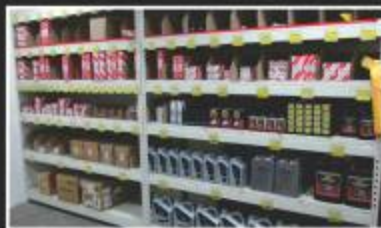
SPARE PARTS / ACCESSORIES