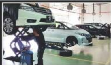
ONE STOP SERVICE CENTER