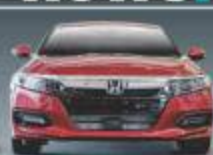
HONDA ACCORD ALL-NEW GENERATION