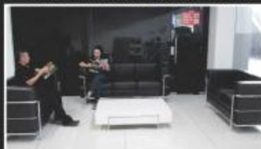
CUSTOMER LOUNGE / WIFI