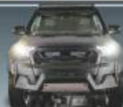
FORD RANGER V146 LIMITED EDITION