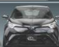
KUHL RACING TOYOTA C-HR US-VERSION