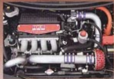
HKS スーパーチャージャー