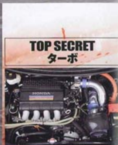
TOP SECRET ターボ